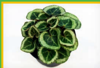
10% TerrAktiv PLUS